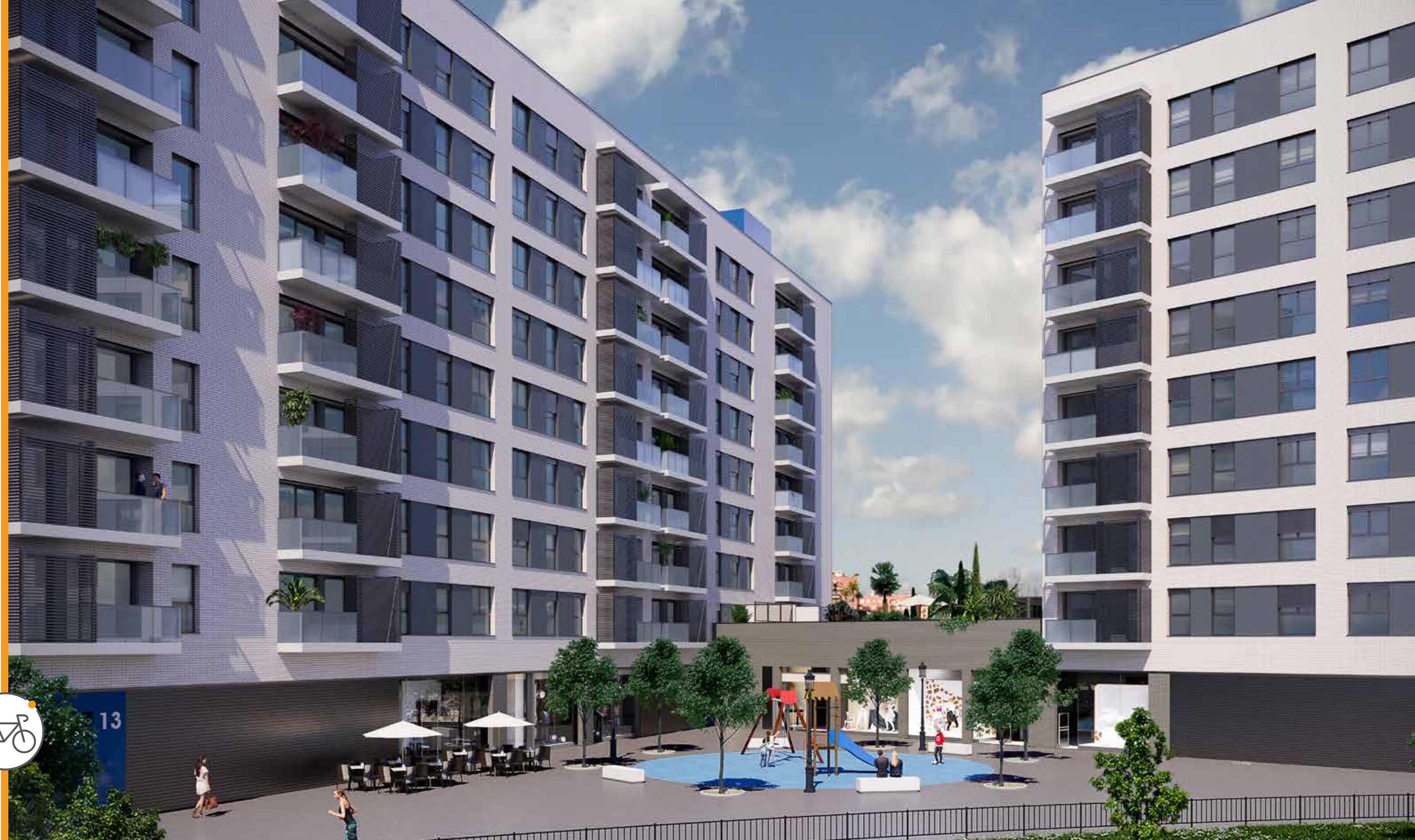
Parking para bicicletas

Toda la documentación gráfica incluida en esta página es meramente orientativa. Los diseños de las zonas comunes de la promoción no muestran los detalles finales, dado que se han combinado con los de otras promociones ya desarrolladas.