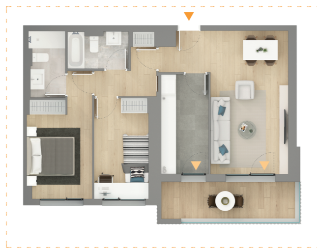
Opción con cocina independiente E:1/150