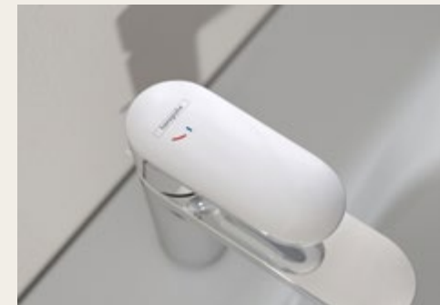
Grifería de lavabo